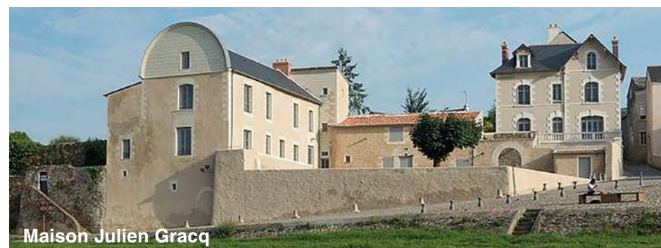
Maison Julien Gracq