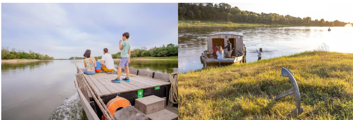
Famille en séjour sur l'Anguille sous Roche sur la Loire (49)

De 2 nuits et quelques heures de navigation à la semaine ou plus, Fabien construit des parcours en amont et en aval de Saint-Florent-le-Vieil , puisqu'il a fait de la Petite Cité de Caractère® son port d'attache. Faisant appel à ses connaissances et à son goût pour la région, il a sélectionné 5/6 villages des bords de Loire et de Maine dans lesquels il propose à ses passagers de faire escale. C'est à l'aide d'un road book agrémenté d'idées d'activités et de bonnes adresses pour faire leurs courses au local ou dîner au restaurant que les passagers pourront découvrir une partie de l'Anjou ou de la Loire Atlantique. A bord, les clients seront totalement autonomes. Le bateau est doté d'un espace salon, d'une cuisine, d'une chambre avec un grand lit et un lit superposé, idéal pour les enfants, une salle d'eau avec douche et des toilettes sèches. Le bateau est équipé de panneaux solaires pour limiter son empreinte écologique et on invite ici à faire la vaisselle au savon de Marseille. De quoi découvrir la Loire en toute tranquillité et responsabilité.