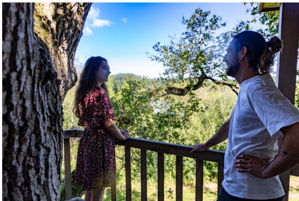
Vue de la terrasse des Cabanes de la Bernardière à Saint-Macaire-en-Mauges (49)