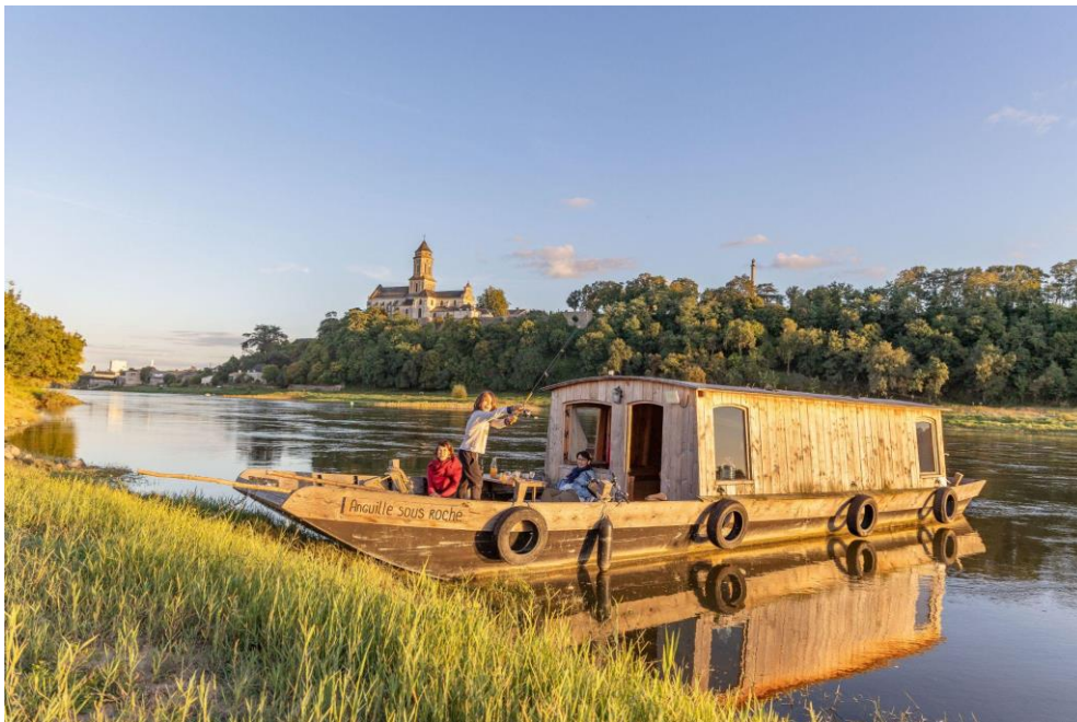
L'Anguille sous Roche amarrée face à la Petite Cité de Caractère® de Saint-Florent-le-Vieil sur la Loire (49)

La tête dans les nuages, les pieds sur l'eau ou les mains dans la laine, autant d'expériences insolites et green à découvrir en famille ou en duo dans les Mauges entre Nantes, Angers et Cholet dans le Maine et Loire. Ici des passionnés ont décidé de faire de leur rêve une réalité et de la réalité un partage. Ils proposent des adresses éco-responsables pour passer une nuit ou plus dans des lieux uniques.